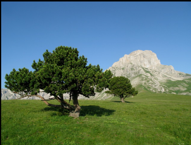
L'Obiou vu depuis le col des Faïsses.