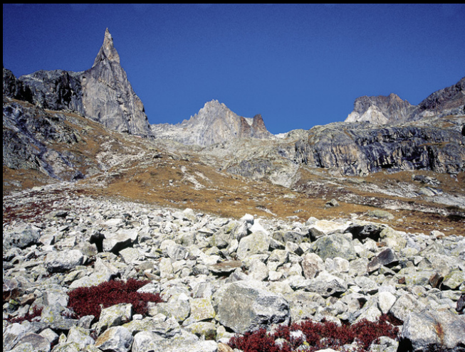
L'Aiguille Dibona, vue depuis l'Amas du Clot.