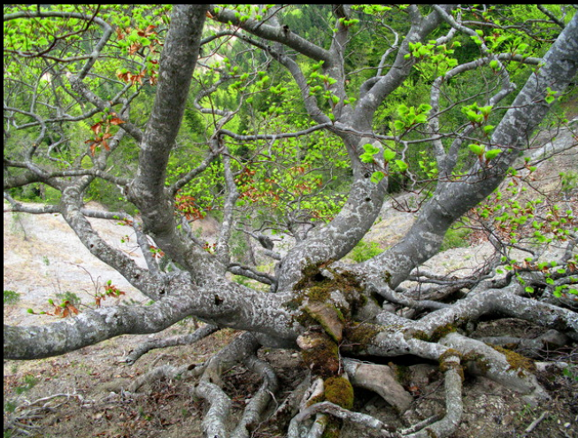
Hêtre fayard au printemps.