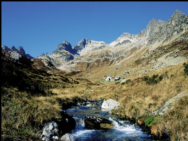
Le vallon de Bacheux.