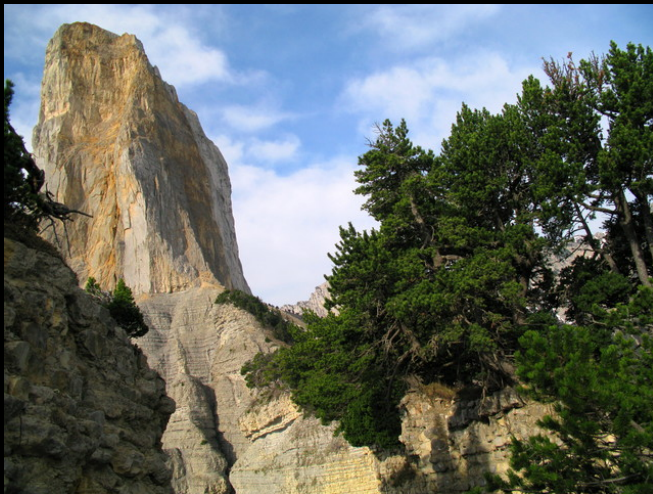
Le Mont Aiguille.